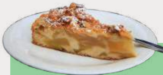
Appelgebak met slagroom 5,00